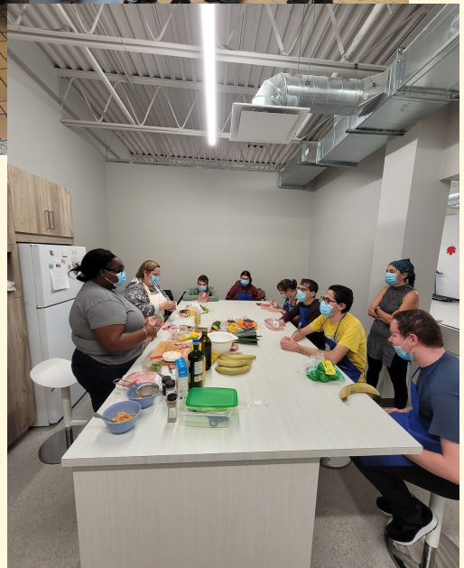
Aperçu de notre année en quelques photos